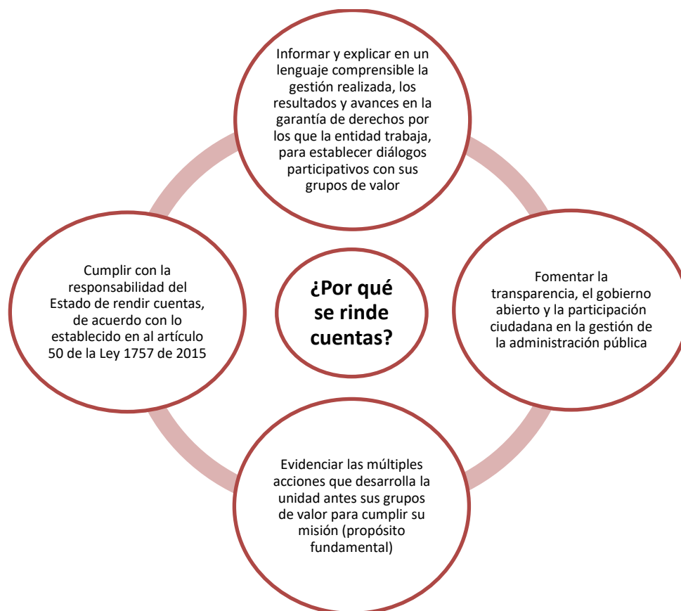
Gráfica 1 ¿Para qué se rinde cuentas?

En la gráfica 1 se muestran los propósitos que se buscan al rendir cuentas