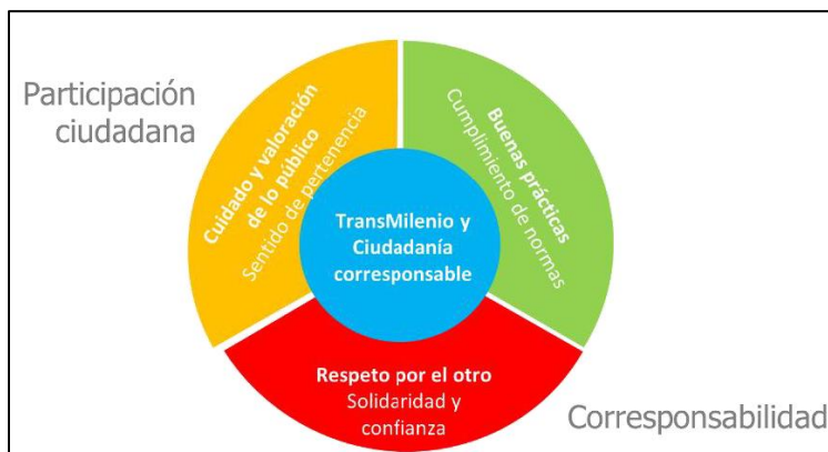
Imagen 1 Modelo de Cultura Ciudadana Equipo T – TRANSMILENIO S. A.