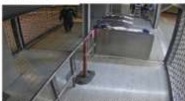
Cámara 5 (Modelo P3225-LVE)