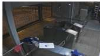
Cámara 3 (Modelo P3225-LVE)