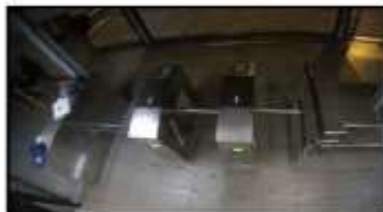
Cámara 4 (Modelo M3046-V)