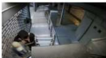
Cámara 2 (Modelo M3046-V)