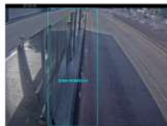
Vista desde la cámara 9