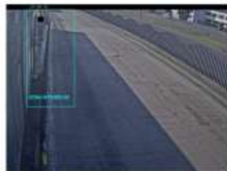
Vista desde la cámara 7