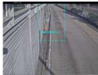
Vista desde la cámara 12