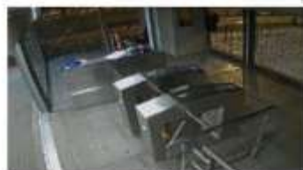
Cámara 1 (Modelo P1435-LE)