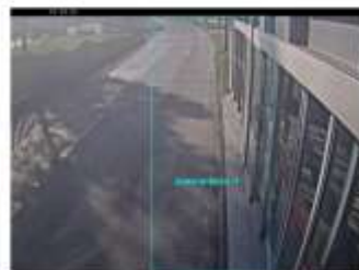
Vista desde la cámara 10