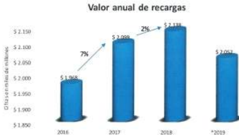
Gráfica 1 Valor anual de recargas